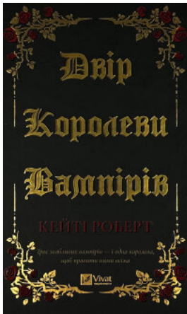
Дві королеви вампірів