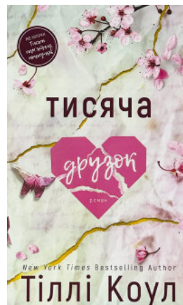
Тисяча друзок. Книга 2