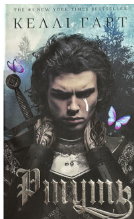
Фейрі й алхімія. Ртуть. Книга 1