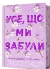
Усе, що ми забули (Limited edition)