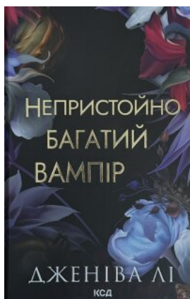
Непристойно багатий вампір. Книга 1