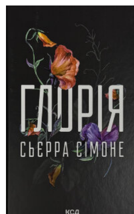
Глорія. Книга 2.5