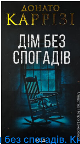
Дім без спогадів. Книга 2