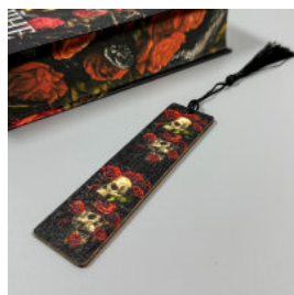
Закладка з черепом та трояндами