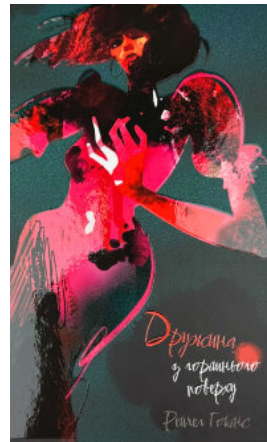
Дружина із горішнього поверху