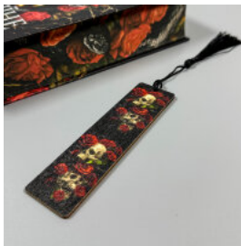
Закладка з черепом та трояндами