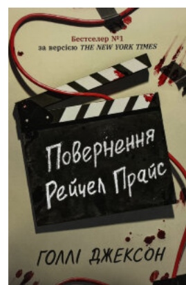
Повернення Рейчел Прайс