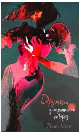
Дружина із горішнього поверху