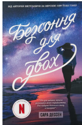
Безсоння для двох