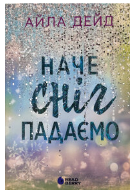
Зимові мрії. Наче сніг падаємо