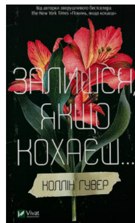
Залишся, якщо кохаєш