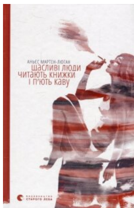
Щасливі люди читають книжки і п'ють каву