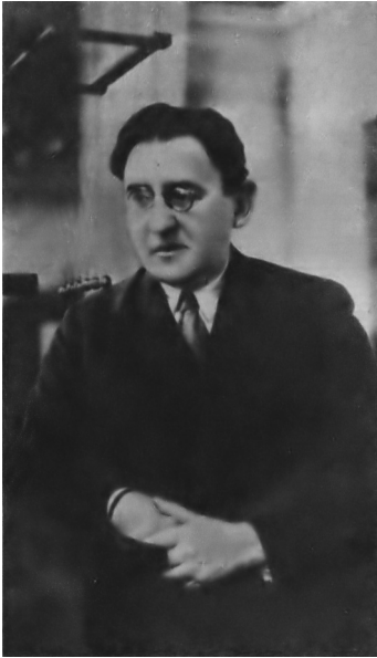
Яків Ісидорович Перельман — творець цілої бібліотеки захоплюючих книг з основ фізико-математичних наук.

у світі. Його книги показували мільйонам школярів романтику наукового пошуку, красу правдивого й безкомпромісного служіння істині, пробуджували дух творчості та винахідництва. Вихована зі шкільних років на цих шляхетних ідеях, молодь з посиленням ентузіазмом вступала у велику науку і велику техніку.