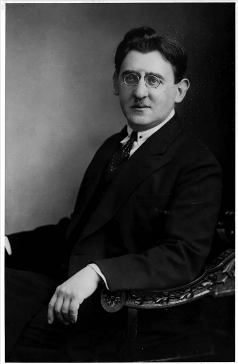
Яків Ісидорович Перельман Фото 1929 р. (Barron Hilton Pioneers of Flight Gallery) 1)