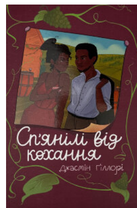
Сп'янілі від кохання