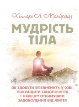
Мудрість тіла: як здобути впевненість у собі, покращити самопочуття і нарешті отримувати задоволення від життя