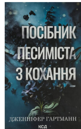
Посібник песиміста з кохання. Книга 2