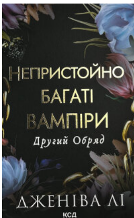
Другий Обряд. Непристойно багаті вампіри. Книга 2