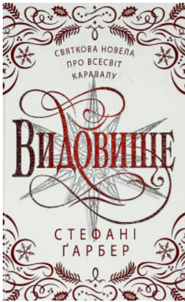
Видовище. Святкова новела про всевіт Каравалу