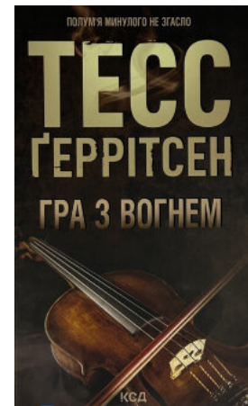
Гра з вогнем