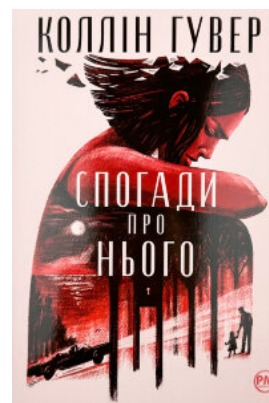
Спогади про нього