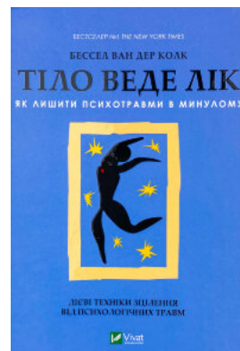
Тіло веде лік. Як лишити психотравми в минулому