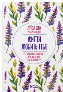
Життя любить тебе. 7 духовних практик для зцілення