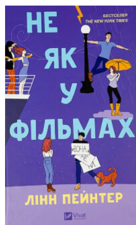
Не як у фільмах