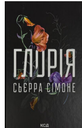
Глорія. Книга 2.5