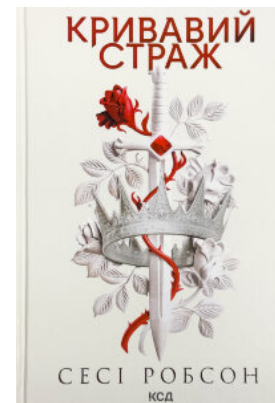
Кривавий страж. Книга 1