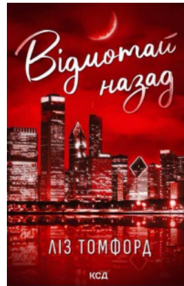
Відмотай назад. Місто вітрів. Книга 5