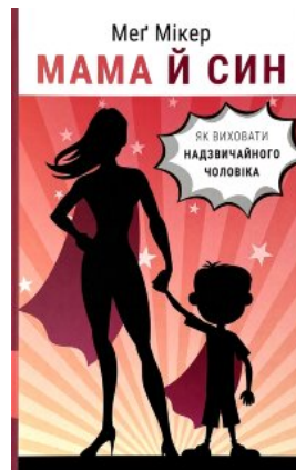
Мама й син. Як виховати надзвичайного чоловіка