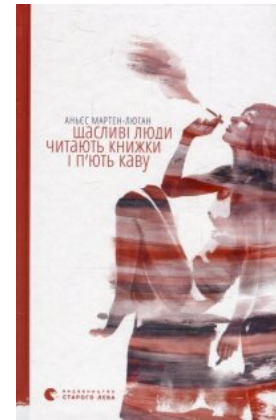
Щасливі люди читають книжки і п'ють каву