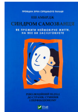
Синдром самозванця. Як прожити неймовірне життя, на яке ви заслужуєте