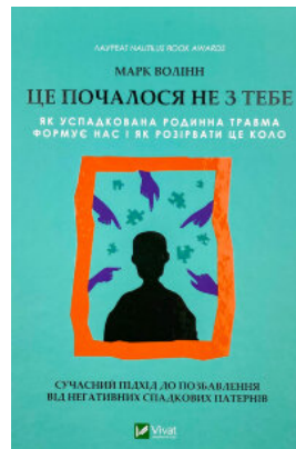
Це почалося не з тебе. Як успадкована родинна травма формує нас і як розірвати це коло