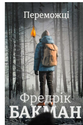
Переможці. Книга 3

Перейти до категорії Біографії і мемуари