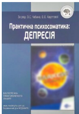
Практична психосоматика: депресія