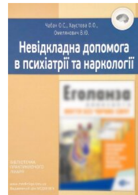
Невідкладна допомога в психіатрії та наркології