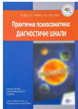
Практична психосоматика: діагностичні шкали