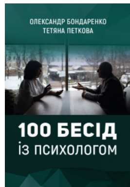
100 бесід із психологом