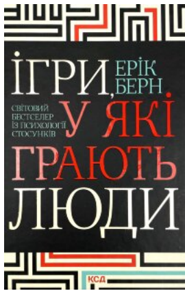
Ігри, у які грають люди