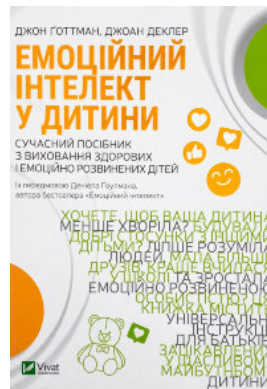
Емоційний інтелект у дитини