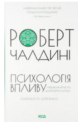
Психологія впливу. Оновлено та доповнено