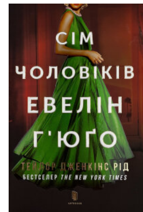
Сім чоловіків Евелін Г'юго

Перейти до категорії Саморозвиток та мотивація