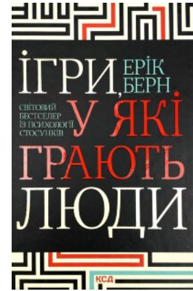
Ігри, у які грають люди