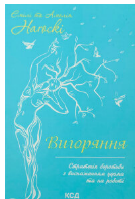
Вигоряння. Стратегія боротьби з виснаженням удома та на роботі