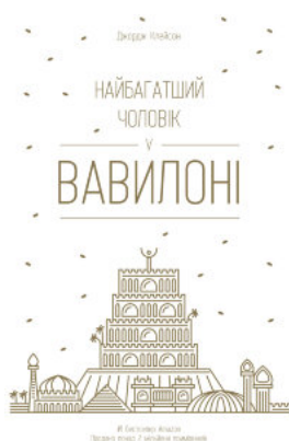
Найбагатший чоловік у Вавилоні