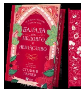
Балада про недовго й нещасливо (Одного разу розбите серце #2) Новинка Бестселер