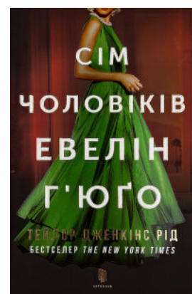
Сім чоловіків Евелін Г'юго