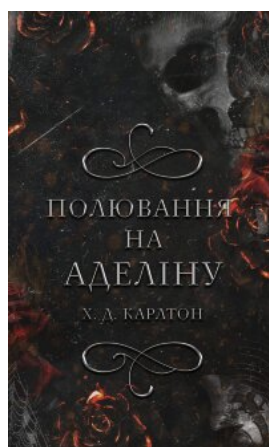
Гра в kota і мишу. Книга 2: Полювання на Аделіну