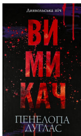
Вимикач. Книга 3