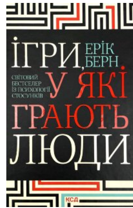
Ігри, у які грають люди