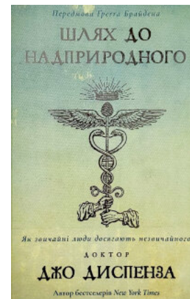
Шлях до надприродного. Як звичайні люди досягають незвичайного