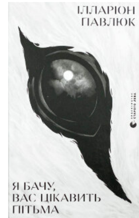
Я бачу, вас цікавить п'ятьма