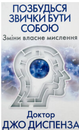
Позбудься звички бути собою. Зміни власне мислення