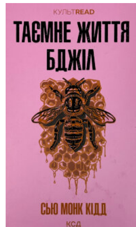
Таємне життя бджіл