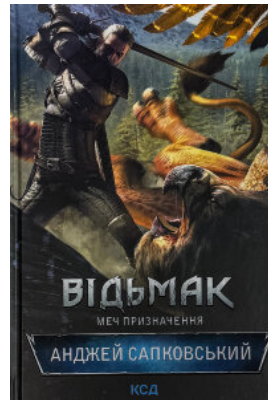
Відьмак. Меч призначення. Книга 2