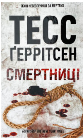
Смертниця. Книга 5