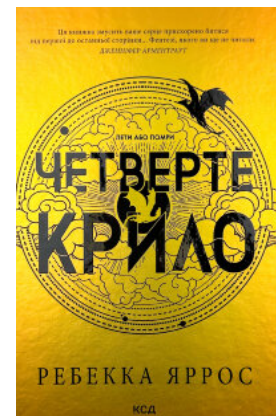
Четверте крило. Емпіреї. Книга 1