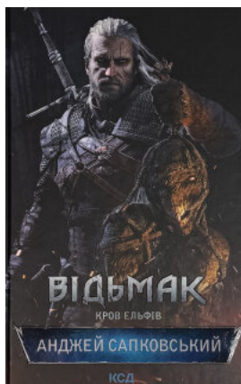
Відьмак. Кров ельфів. Книга 3