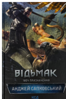
Відьмак. Меч призначення. Книга 2