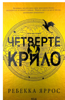
Четверте крило. Емпіреї. Книга 1