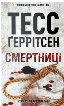
Смертниця. Книга 5