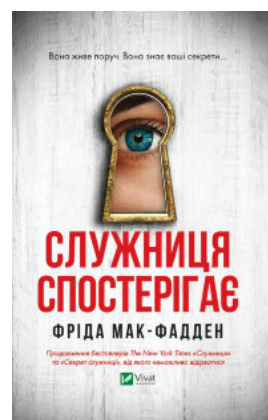
Служниця спостерігає (Служниця #3)