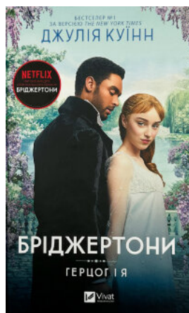
Бріджертони. Герцог і я