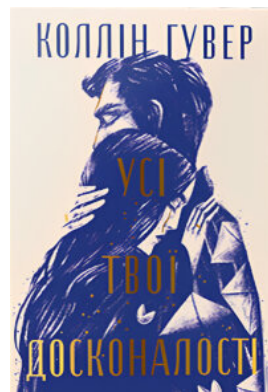
Усі твої досконалості