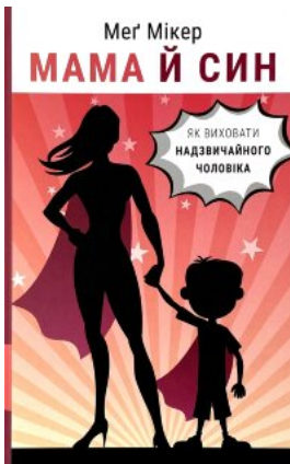
Мама й син. Як виховати надзвичайного чоловіка