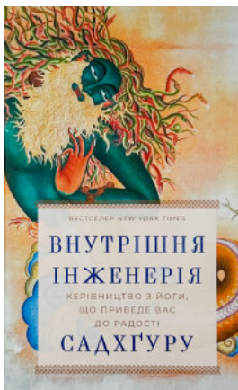
Внутрішня інженерія. Керівництво з йоги, що приведе вас до радості

Перейти до категорії Саморозвиток та мотивація