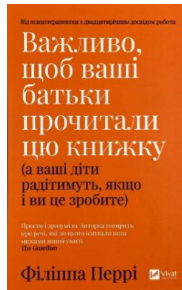
Важливо, щоб ваші батьки прочитали цю книжку (а ваші діти радітимуть, якщо і ви це зробите)