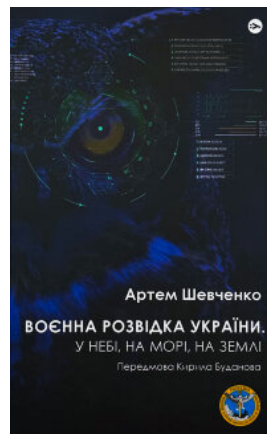
Воєнна розвідка України. У небі, на морі, на землі