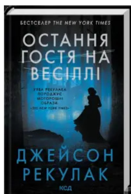
Остання гостя на весіллі