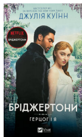
Бріджертони. Герцог і я