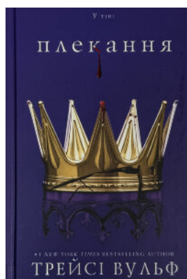
Жага. Книга 6: Плекання