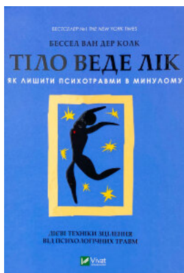
Тіло веде лік. Як лишити психотравми в минулому