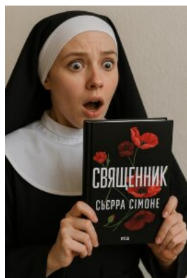
Священник. Книга 1