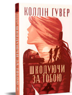
Шкодуючи за тобою