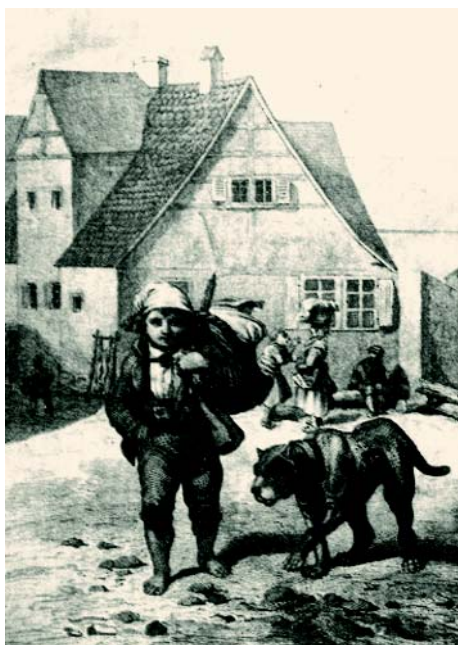
Иоганн Якоб Астор, покидающий дом в Валлдорфе в возрасте 15 лет (современная иллюстрация)

инструментов. А в двадцать лет Астор покидает и Лондон, захватив с собой десяток собственноручно изготовленных деревянных духовых инструментов. Путь его лежит в Америку, где он отмечает свое совершеннолетие. Там, в Новом Свете 2 , он делает блестящую карьеру. Астор мечтал об открытии в Нью-Йорке магазина музыкальных инструментов, единственного в своем роде, но начать зарабатывать деньги ему пришлось с тяжелого труда уличного рабочего, а затем уличного торговца. Понятно, однако, что эмигрант, приехавший в Америку, хотел чего-то большего, нежели торговать музыкальными инструментами, тем более, что успех, к которому он стремился, все не приходил 3 . Поэтому