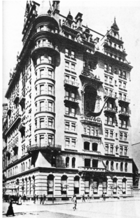
Отель «Вальдорф-Астория» в Нью-Йорке, около 1900 года

Так бывший портье Джордж Болдт стал первым менеджером гостиницы «Вальдорф-Астория» в Нью-Йорке, следуя библейскому высказыванию, по которому не стоит отворачиваться от тех, кто нуждается в помощи, потому что они могут оказаться посланцами ангелов 7 .