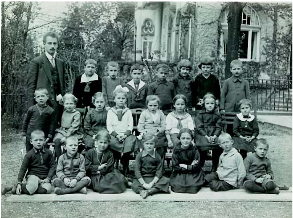
1 клас в 1920 році

Завдяки цьому виявляється тісний зв'язок методики та дидактики, який належить до основних властивостей вальдорфської педагогіки.