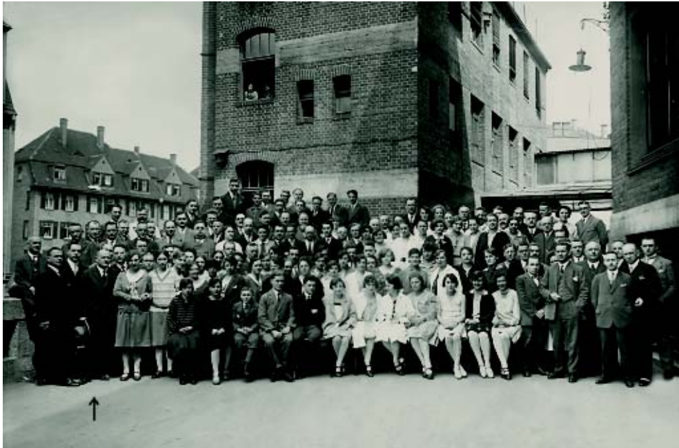
Працівники тютюнової фабрики «Вальдорф-Асторія» з Емілем Мольтом (позначений стрілкою) в Штутгарті, приблизно 1920 року