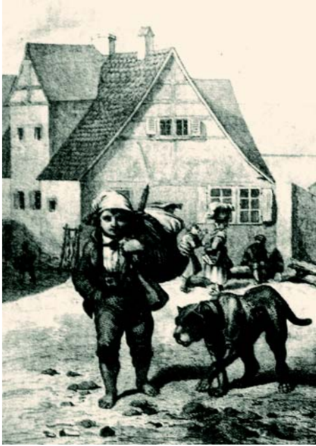
Джон Якоб Астор покидає дім у Валлдорфі у віці 15 років (сучасна ілюстрація)

У віці двадцяти років, прихопивши з собою декілька духових дерев'яних інструментів, виготовлених власноруч, він вирушив в Америку, де відзначив своє повноліття.