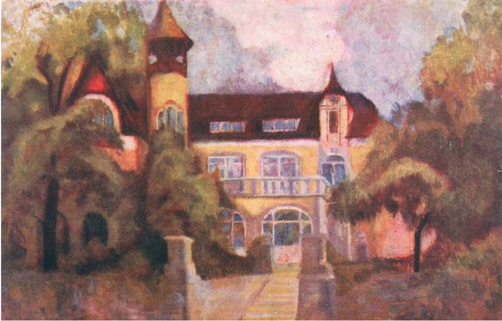
Вальдорфська школа Уландсхоє в Штутгарті, в минулому ресторан. Намальовано Софі Бауер

Розбиття навчального матеріалу на шматочки, що реалізується в 45-хвилинних уроках, які розподілено відповідно до тижневого навчального плану, усувається під час проведення епохальних уроків. Завдяки цьому, працюючи впродовж декількох тижнів (щоранку приблизно по 110 хвилин), для учнів стає можливим сконцентруватися на різних навчальних галузях, наприклад, на історії, де формується багато нових уявлень. Така методика веде до заглиблення у суть речей.