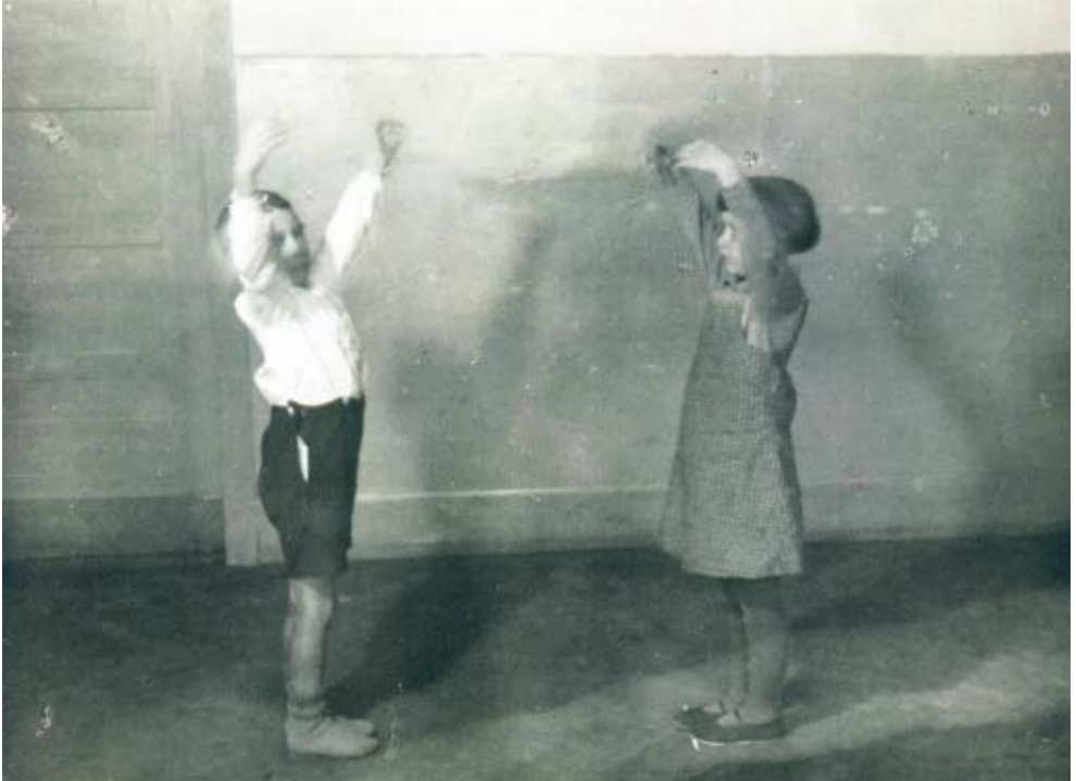
Евритмія на самому початку

Особливого значення набуває в цьому контексті евритмія, яка втілює душевні переживання мови та музики через рухи в просторі. У вальдорфських школах евритмія є регулярним заняттям.