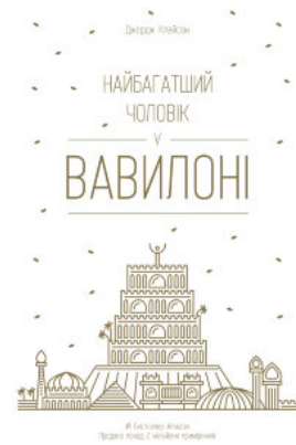
Найбагатший чоловік у Вавилоні