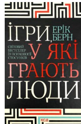
Ігри, у які грають люди

Перейти до категорії Саморозвиток та мотивація