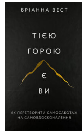
Тією горою є ви. Як перетворити самоботаж на самовдосконалення