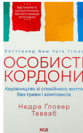
Особисті кордони. Керівництво зі спокійного життя