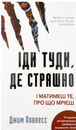
Іди туди, де страшно. І матимеш те, про що мрієш