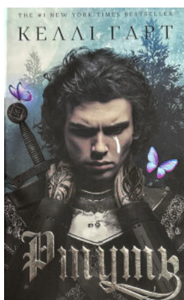
Фейрі й алхімія. Ртуть. Книга 1