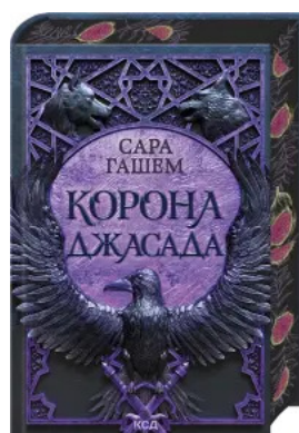
Корона Джасада. Книга 2