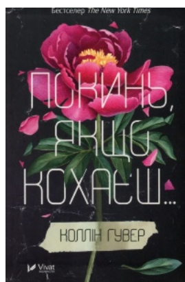
Покинь якщо кохаєш