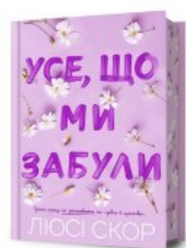
Усе, що ми забули (Limited edition)