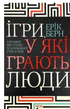
Ігри, у які грають люди