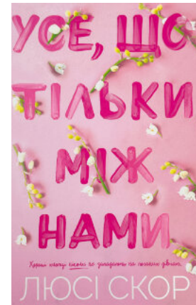
Усе, що тільки між нами (Limited edition)