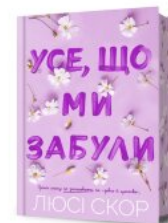
Усе, що ми забули (Limited edition)