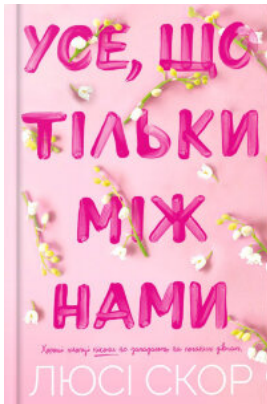
Усе, що тільки між нами