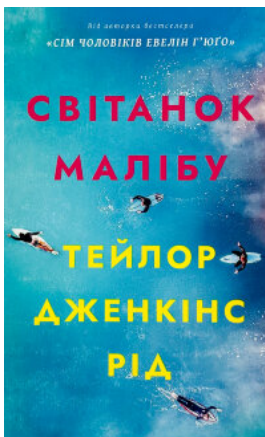
Світанок Малібу (paperback)