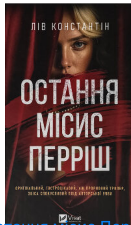
Остання місіс Перріш