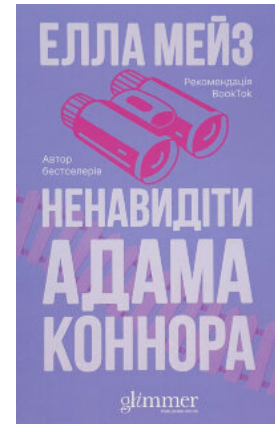
Ненавидіти Адама Коннора