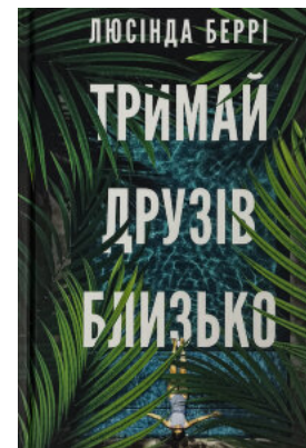
Тримай друзів близько