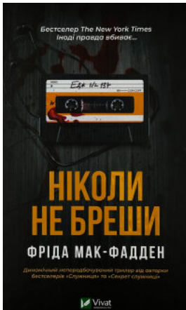
Ніколи не бреші