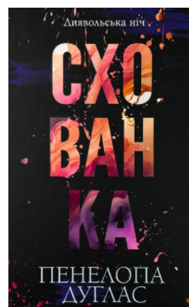
Схованка. Книга 2