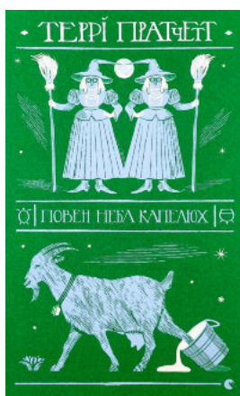
Повен неба капелюх