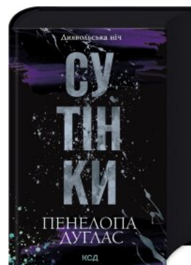
Сутінки. Книга 4