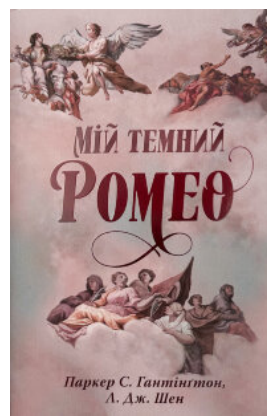
Мій темний Ромео. Дорога темного принца. Книга 1