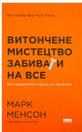
Витончене мистецтво забивати на все