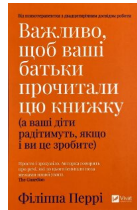
Важливо, щоб ваші батьки прочитали цю книжку (а ваші діти радітимуть, якщо і ви це зробите)