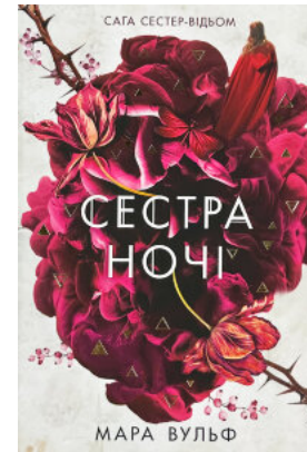
Сестра ночі. Книга 3. Сага сестер-відьом