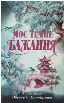
Моє темне бажання. Дорога темного принца. Книга 2