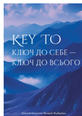
KEY TO. Ключ до себе - Ключ до всього