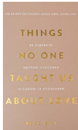
Things No One Taught Us About Love. Як будувати здорові стосунки із собою та оточенням