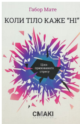
Коли тіло каже «ні». Ціна прихованого стресу