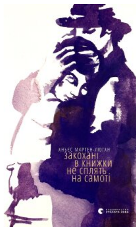
Закохані в книжки не сплять на самоті