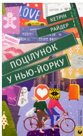
Поцілунок у Нью-Йорку