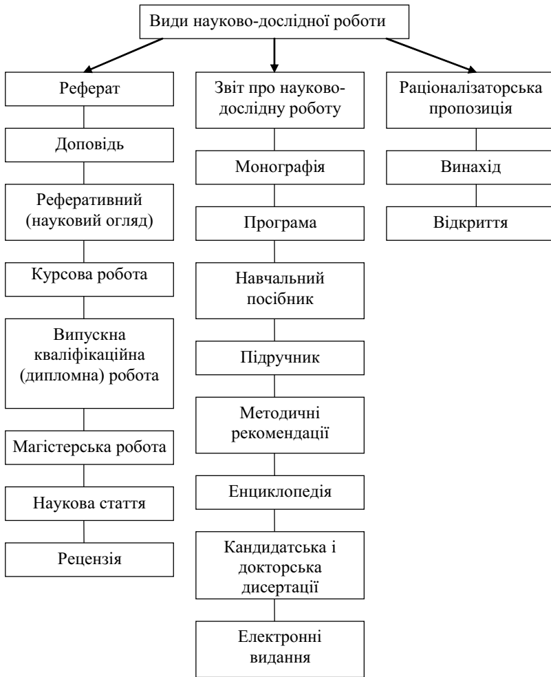
Рис. 1.2. Основні види наукової та науково-методичної роботи

ституту (університету). Але це зазвичай обсяг у межах 10 сторінок комп'ютерного (рукописного) тексту. Бажано, щоб реферат мав спеціально оформлену титульну сторінку і був структурований.