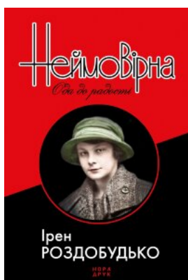
Неймовірна. Ода до радості. Роман