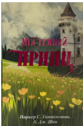
Мій темний принц. Дорога темного принца. Книга 3