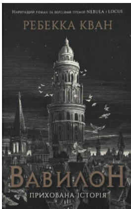
Вавилон. Прихована історія (кольоровий зріз)