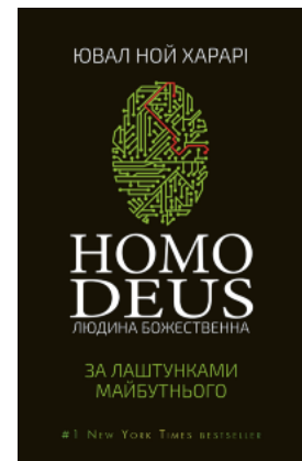
Номо Деус: за лаштунками майбутнього