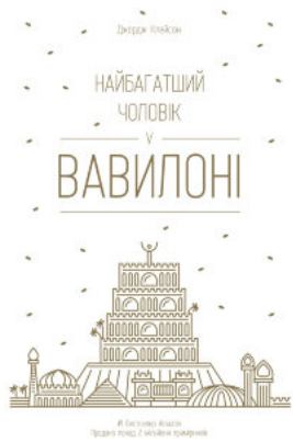
Найбагатший чоловік у Вавилоні