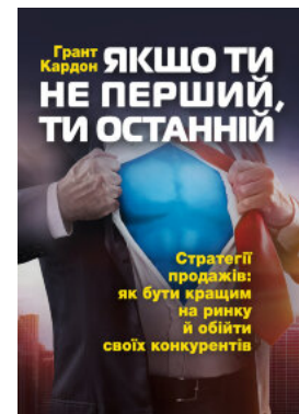
Якщо ти не перший, ти останній. Стратегії продажів: як бути кращим на ринку й обійти своїх конкурентів

Перейти до категорії Саморозвиток та мотивація