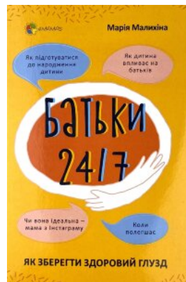
Батьки 24/7. Як зберегти здоровий глузд