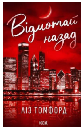
Відмотай назад. Місто вітрів. Книга 5