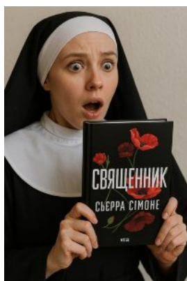
Священник. Книга 1