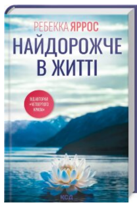
Найдорожче в житті