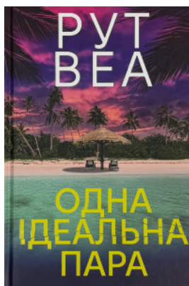
Одна ідеальна пара